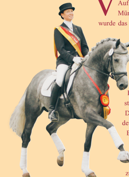
Denario v. Denaro: Körsieger 2006 – Bundeschampion 2007

Die Erfolge der bisherigen süddeutschen Körteilnehmer vom Bundeschampion über Süddeutsche- und Landes-Champions unterstreichen eindrucksvoll den Eliteanspruch des Körplatzes München.