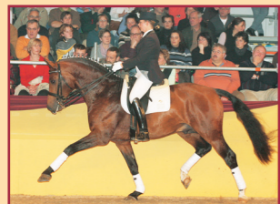
Ruben As v. Rohdiamant/Lucarlo 7x S-Dressur gewonnen Süddeutscher Prämienhengst