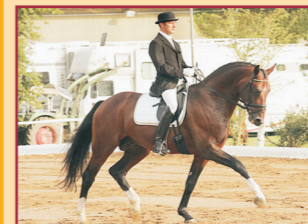
Don Argentinus v. Davignon/Argentinus Deckstation Heuschmann Qualifiziert Bundeschampionat '07 4x Dressurpferde M gewonnen

Süddeutsche Hengsttage am 25. und 26. Januar online unter www.sueddeutsche-hengsttage.de