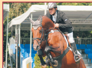
FBW Coneli v. Candillo/Gralshüter Finalist Bundeschampionat Springen 2007