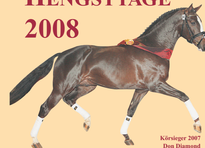
Körsieger 2007 Don Diamond Sieger 30-Tage-Test