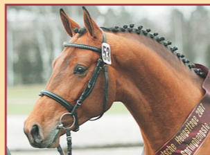
Landry v. Landprinz/Le Matin Gestüt Döbel Springsieger Süddt. Körung '07 30-Tage-Test: Springnote 8,53