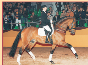
Alassio's Boy v. Alassio/Heraldik xx Gestüt Birkhof Vizebundeschampion vierj. Hengste '06, Südd. Champion '06 u. '07